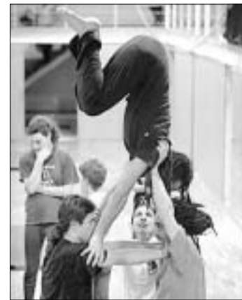
Alumnos de la escuela de circo.

gitud) uniría Santa María de la Cabeza con Méndez Álvaro. El segundo (de 2 kilómetros) irá desde el puente de Segovia a la N-V y el tercero (de 4,4 kilómetros), de Chamartín a Puerta de Hierro. PASA A LA PÁGINA 4