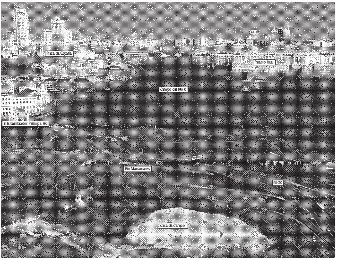
Imagen aérea de la zona en la que Alberto Ruiz-Gallardón quiere extender la 'alfombra' que unirá la plaza de España con la Casa de Campo.

Quiere unir la Casa de Campo y la plaza de España, y convertir el Matadero en mucho más que el Pompidou y el Covent Garden /2