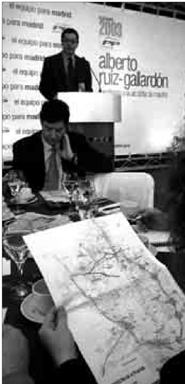
Ruiz-Gallardón, al fondo, durante la presentación de la reforma de la M-30.

Por eso se proponen varias intervenciones en este sentido. Las tres más destacadas son: un paso subterráneo que saque los coches a la M-30 desde Sor Ángela de la