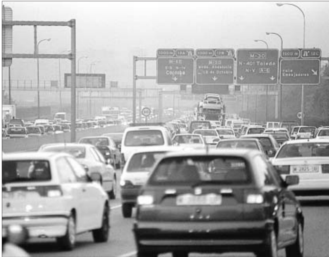
Atasco en el nudo sur de la M-30 en plena hora punta.

Los populares están elaborando un gran estudio, que estará aca-