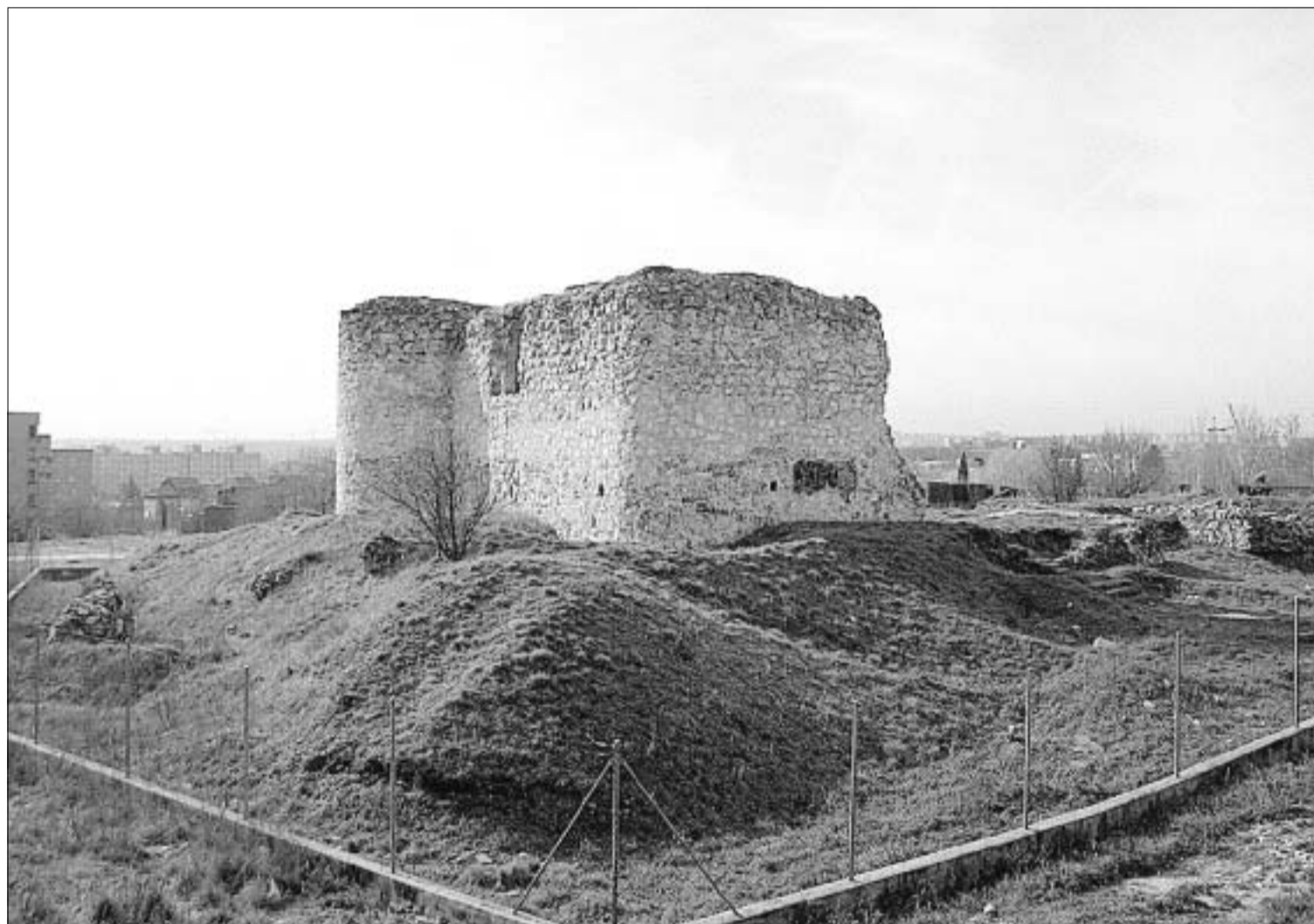
Vista del parque en el que se encuentra el castillo de la Alameda de Osuna, rodeado por una valla metálica.

ENRIQUE RUBIO, Madrid El castillo de la Alameda de Osuna tiene dos historias: una, la oficial, arranca en el siglo XV, con su construcción, y llega hasta el día de hoy, en que se ha convertido en la única fortificación medieval que queda en pie en la ciudad de Madrid. La otra, la del día a día, es la de los jóvenes de este barrio del distrito de Barajas, dueños y señores de una construcción que se cae a pedazos. En su historia se entremezclan relatos de fantasmas, túneles secretos, peleas al atardecer y botellones multitudinarios.