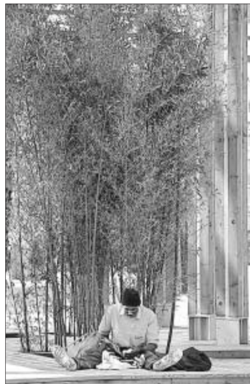
A la izquierda, uno de los nuevos puentes que cruzan el Manzanares. A la derecha, un hombre en uno de los rincones del parque.

puntos de tráfico más intenso en la M-30.