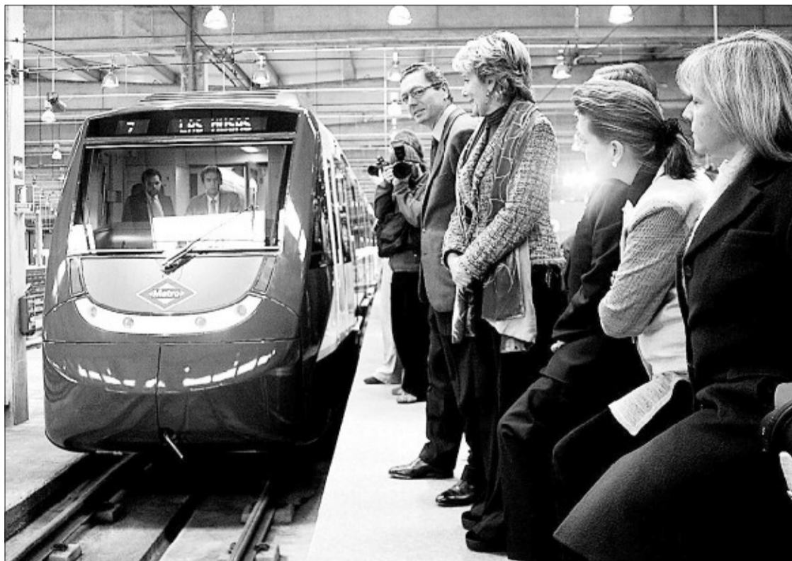
Esperanza Aguirre y Alberto Ruiz-Gallardón asisten a la presentación de los nuevos trenes de metro.

En apariencia, los vagones son como otros del modelo 8.000 que ya circulan desde hace años por la red, pero incorporan rampas de acceso para personas con movilidad reducida y "los más modernos sistemas de seguridad".