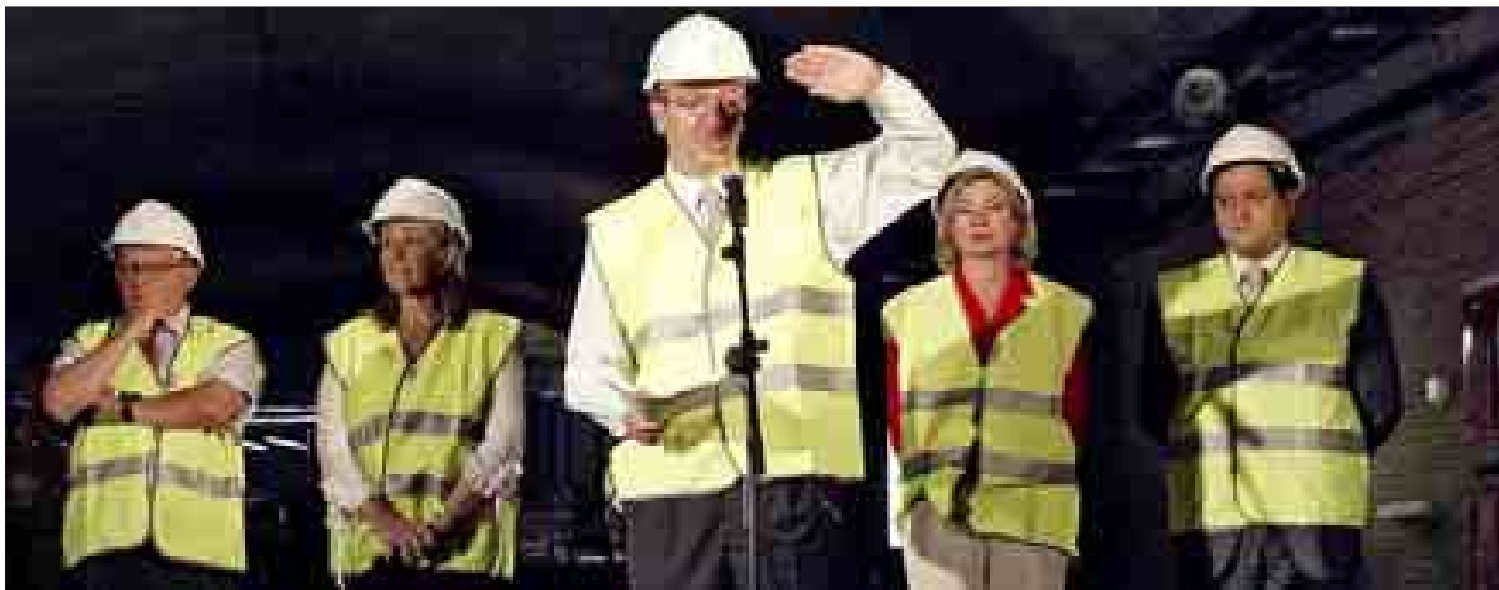
El alcalde de Madrid, junto a los concejales de Chamartín y Fuencarral (dcha.) y la edil de Urbanismo y el Coordinador de Urbanismo (izqda.).

Habrà que esperar. El final de este viaje se escribirà en pocos meses. La eurodiputada danesa se lleva un recuerdo, «el del cariño de los madrileños por los árboles de su ciudad». Y el irlandés, una reflexión: «La posibilidad de sugerir al Gobierno español un cambio legislativo que evite que se produzca una situación similar en el futuro».