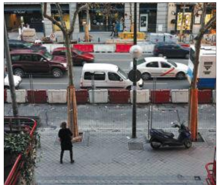
Remodelación de la calle de Serrano.

El Ayuntamiento afirmó que ha informado a los vecinos afectados mediante una carta y les pide "comprensión y colaboración". Mientras duren los trabajos se habilitarán espacios en la calzada para no impedir el tránsito de los peatones ni el acceso a portales, locales y vados. En todo momento se permitirá la circulación de vehículos.