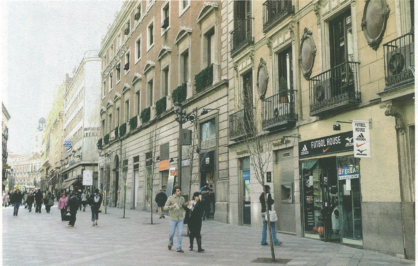
Los coches en el centro de Madrid han sido sustituidos por los peatones.

Protagonista de este cambio es, sin duda alguna, el río Manzanares cuya recuperación es también uno de los objetivos fundamentales de este proyecto de transformación urbana de la M-30. Esta recuperación conocida como Proyecto Madrid Río consiste en el soterramiento de seis kilómetros de la vía de circunvalación para liberar una superficie de casi medio millón de metros cuadrados de zona verde. El proyecto se basa en dos aspectos fundamentales. Por un lado, se ha planteado hacer el río