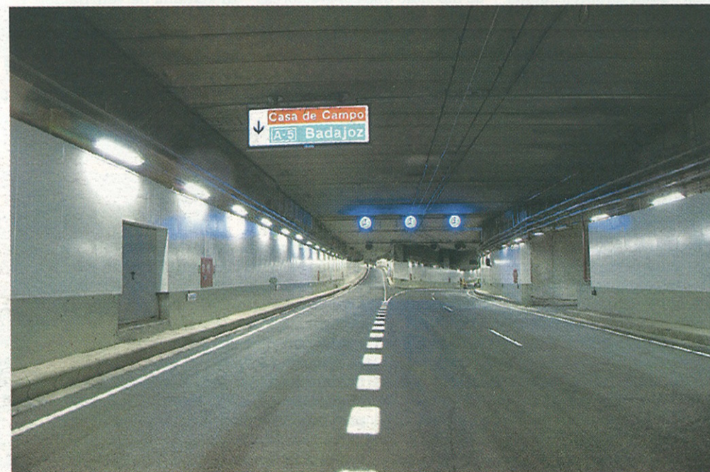
Treinta años separan el antes y el hoy de la primera vía de circunvalación madrileña, la M-30.